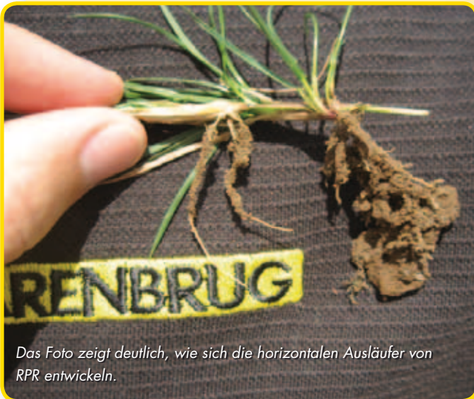
Das Foto zeigt deutlich, wie sich die horizontalen Ausläufer von RPR entwickeln.

Dank der RPR-Technologie werden Rasenstücke nicht so schnell von Golfschlägern herausgeschlagen. Der Rasen behält seine hohe Qualität, auch wenn er großer Belastung ausgesetzt ist und starke Schläge aushalten muss. Abschläge und Fairways bewahren eine dichte Grasnarbe, die eine intensive Nutzung verträgt und beständig gegenüber Rasenlöchern ist.